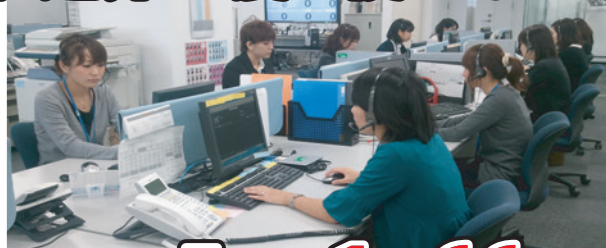
※ベンハウスIT電話サポートセンターの写真です

3 駆けつけ復旧サポート付のコースなら、10名のMS技術者IT資格者が迅速に駆けつけます。