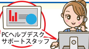
PCヘルプデスクサポートスタッフ