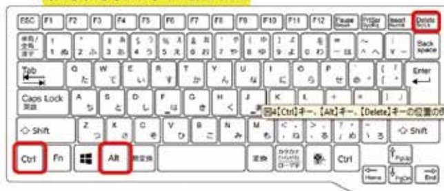
図4 【Ctrl】キー、【Alt】キー、【Delete】キーの位置の例

2. 画面右下の『電源ボタンアイコン』をクリックして、『再起動』を選択してください。