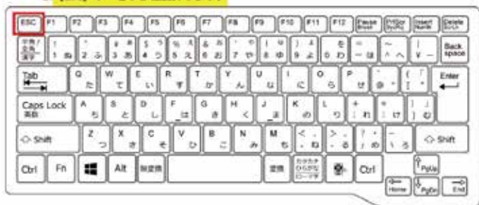
図2 【Esc】キーの位置の例

2. 【Esc】キーを長押しした後、画面右上に表示されたXを押します。 これにより警告画面を閉じることができます。