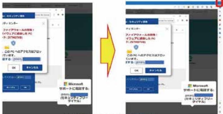
図3 画面右上に表示されるXの位置の例

2. 【Esc】キーを長押しした後、画面右上に表示されたXを押します。 これにより警告画面を閉じることができます。