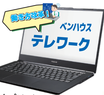
テレワークパソコン