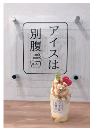
デジタル工房：田中あや

ご存知の方も多いかと思いますが、実はこれ、姫路本町商店街にオープンした夜パフェ専門店の店名なんです。テレビにも取り上げられ、お店の前には毎日長蛇の列ができています。そんな「アイスは別腹」に、念願叶って行ってまいりました！「別腹」「夜パフェ」というだけあって、食後のデザートにしてはちょっと多めかも…でも美味しいからぺろっといけちゃう！という絶妙なサイズ感。口当たりのいい濃厚なソフトクリームに、ホワイトチョコソースが染み込んだスポンジの層…。夜に食べるには罪深すぎる美味しさでした。姫路でディナーを楽しんだあと、仕事終わり、ちょっと特別な日に、自分へのご褒美にぜひ足を運んでみてください。