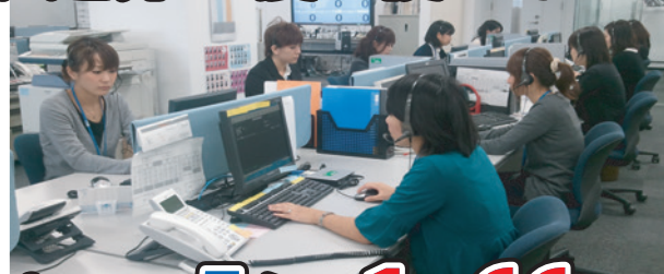
※ベンハウスIT電話サポートセンターの写真です

3 駆けつけ復旧サポート付のコースなら、10名のMS技術者IT資格者が迅速に駆けつけます。